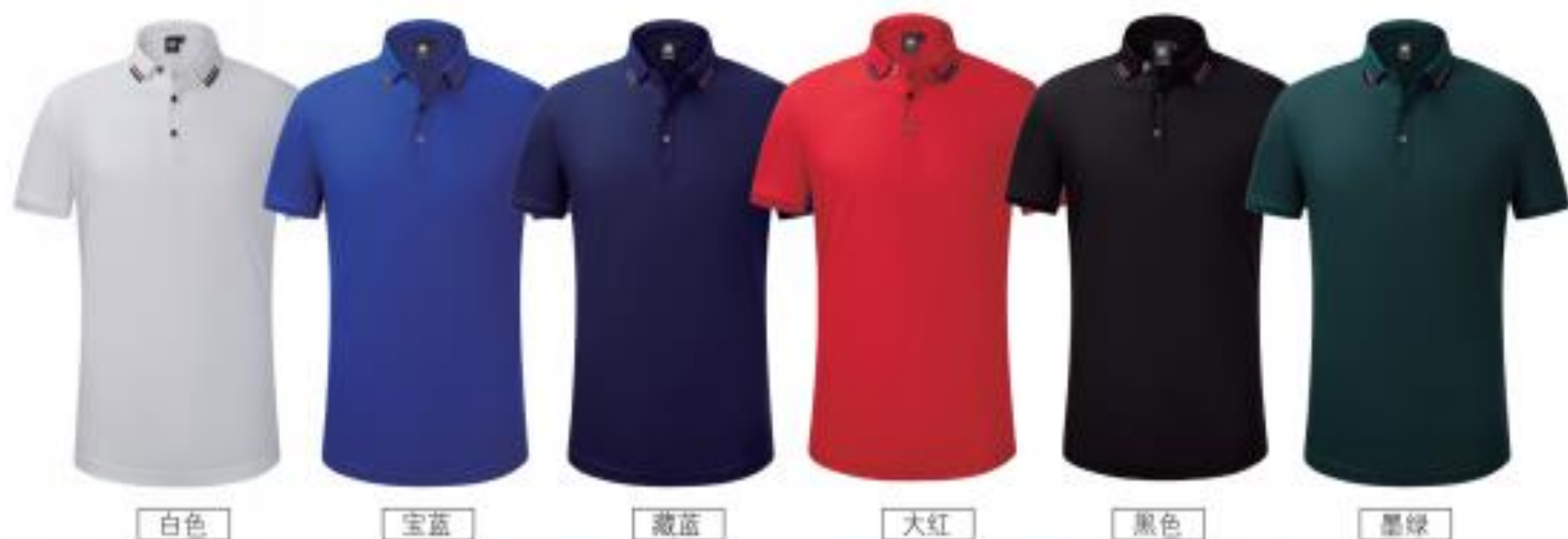
白色 宝蓝 藏蓝 大红 黑色 墨绿