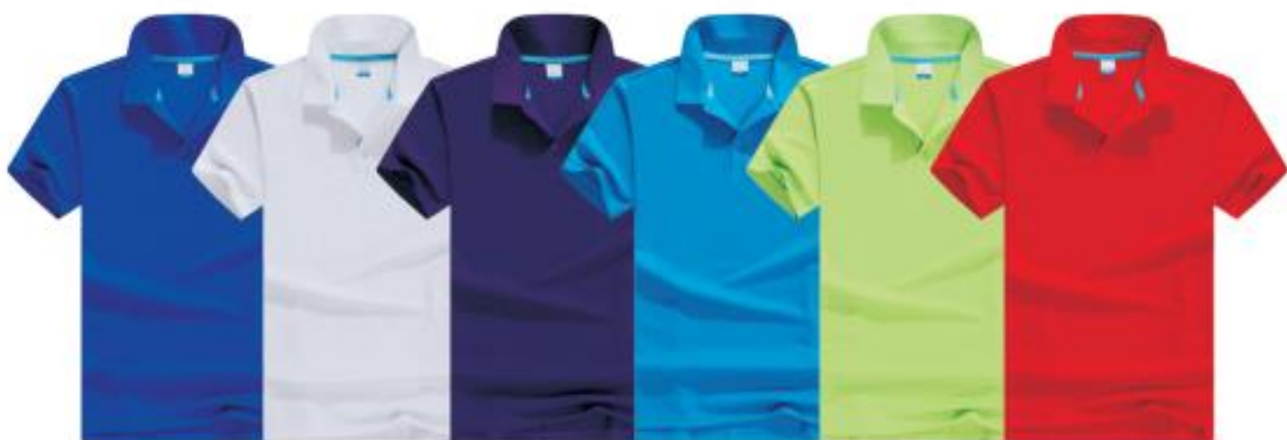
宝蓝 白色 紫色 湖蓝 明绿 红色