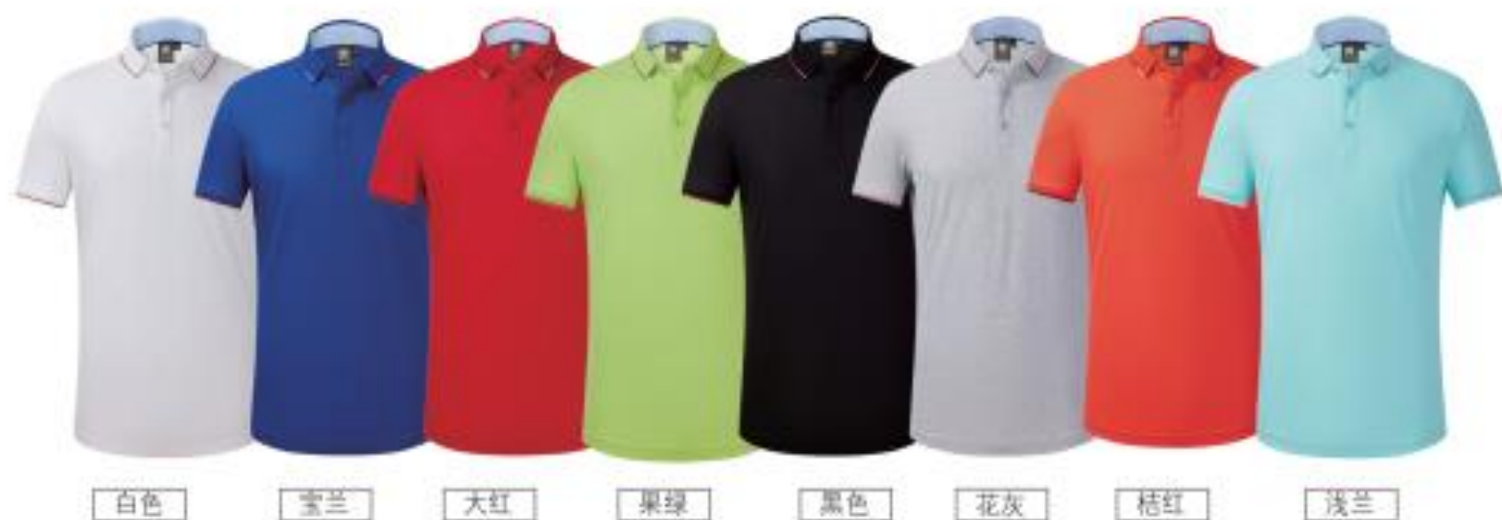
白色 宝兰 大红 果绿 黑色 花灰 桔红 浅兰