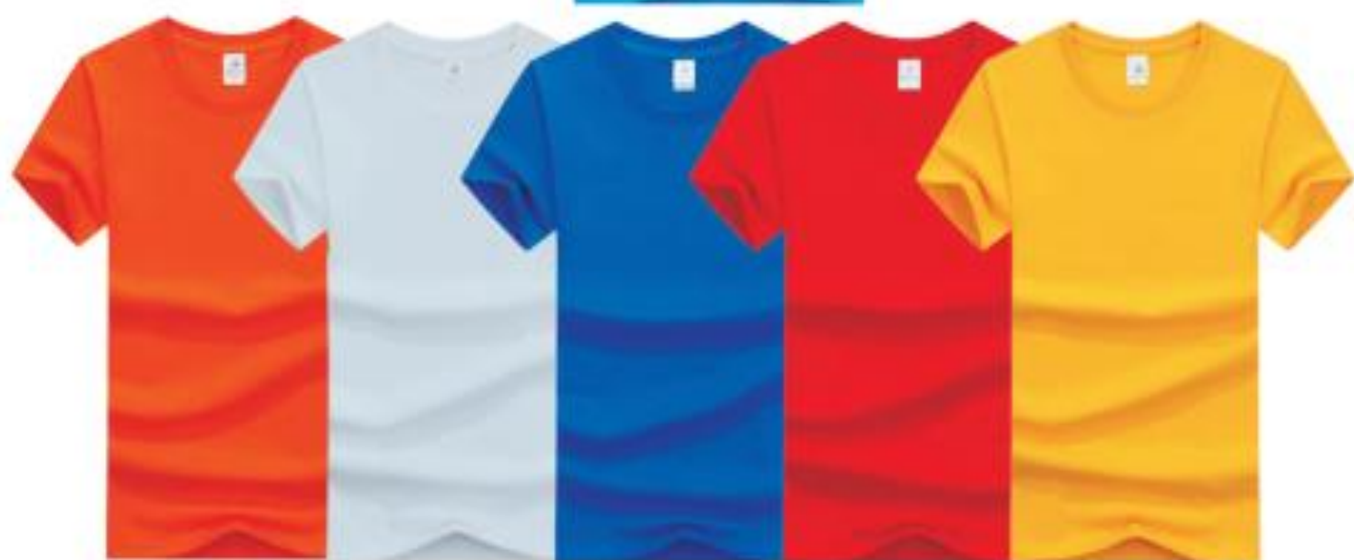
橙色 白色 宝蓝 红色 香蕉黄