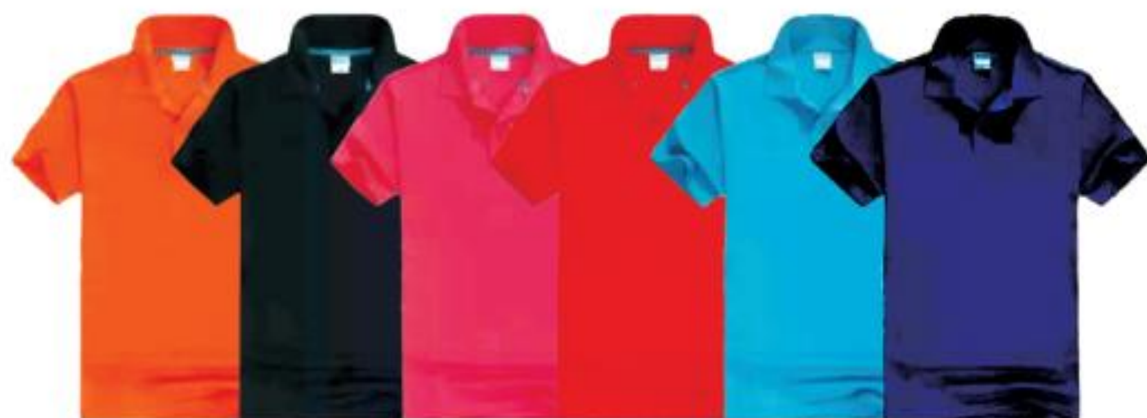
橙色 黑色 玫红 红色 湖蓝 宝蓝