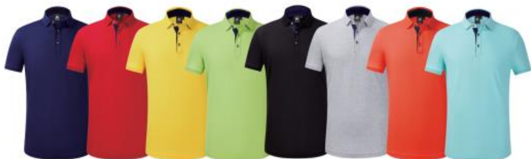
藏兰 大红 亮黄色 果绿 黑色 花灰 桔红 浅兰