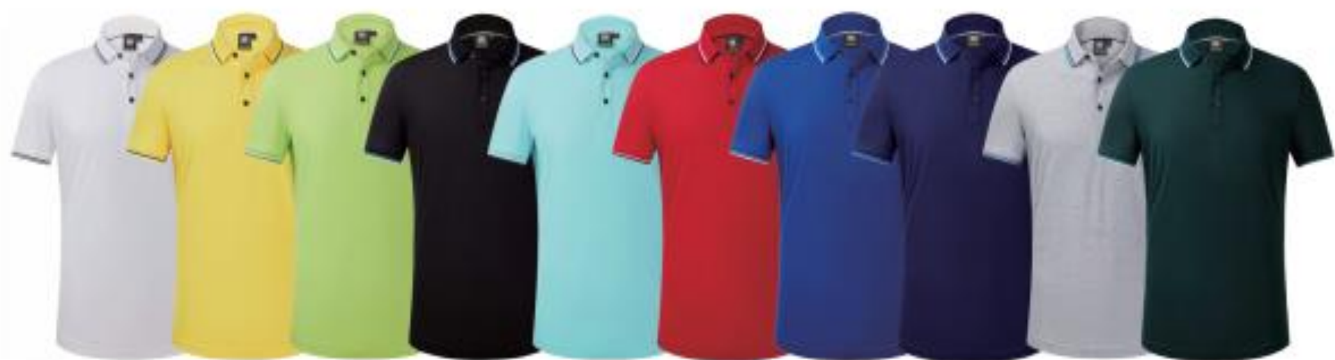
白色 巨黄 果绿 黑色 浅兰 大红 宝兰 藏兰 花灰 墨绿