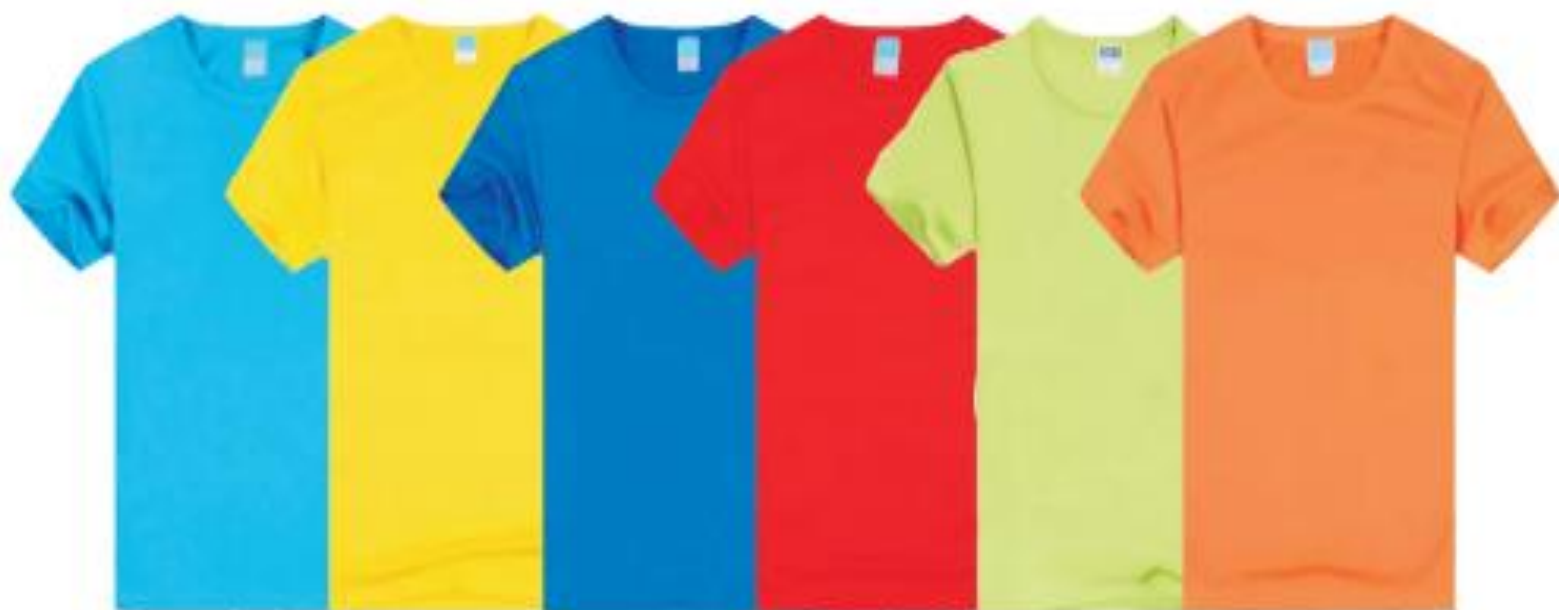
湖蓝 香蕉黄 宝蓝 红色 明绿 橙色