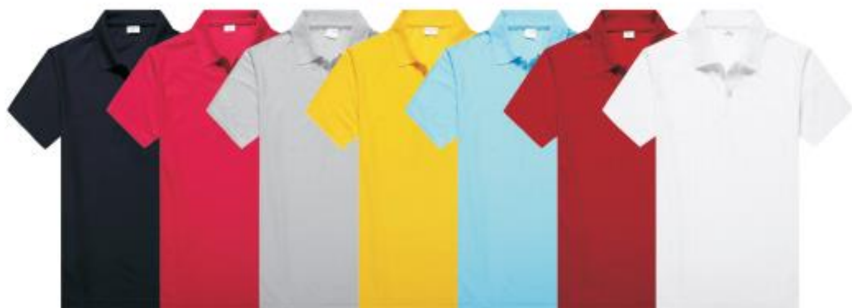
黑色 玫红 麻灰 香蕉黄 天蓝 红色 白色