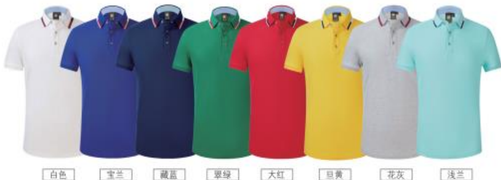
白色 宝兰 藏蓝 翠绿 大红 巨黄 花灰 浅兰