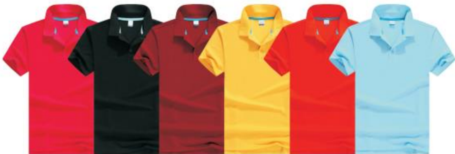
玫红 黑色 酒红 香蕉黄 橙色 天蓝