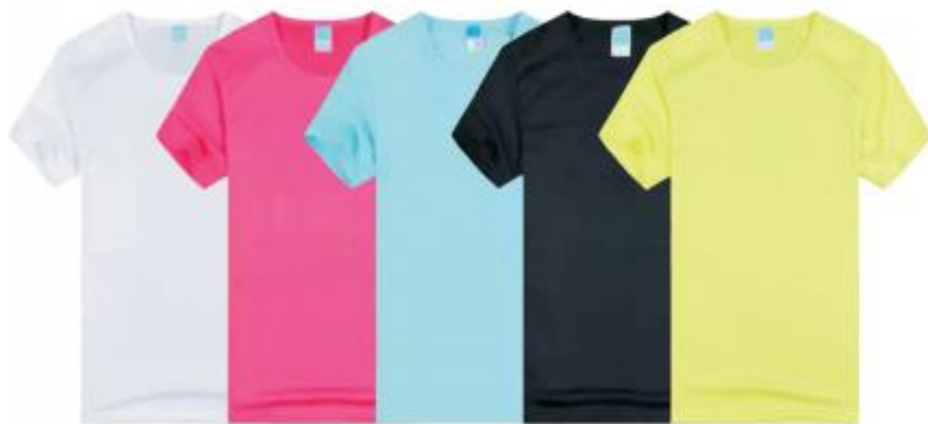
白色 玫红 天蓝 黑色 荧光绿