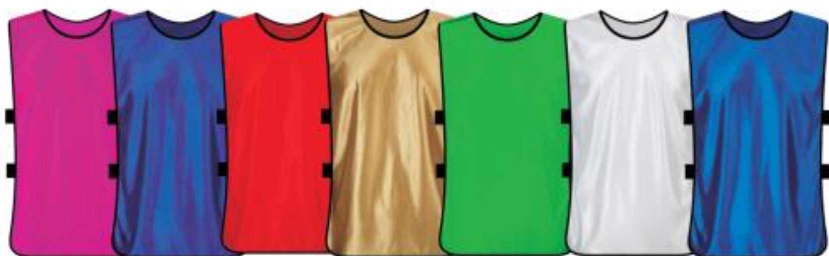
玫红 紫色 红色 土豪金 翠绿 白色 宝蓝