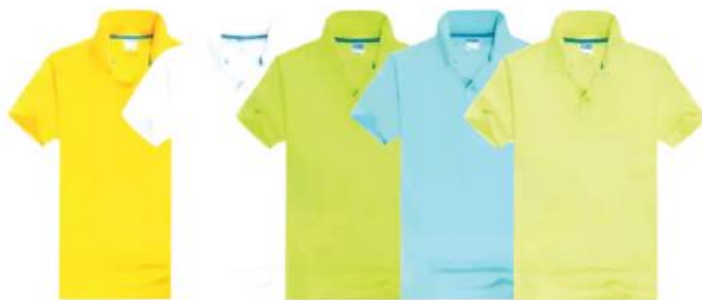
香蕉黄 白色 明绿 天蓝 荧光绿