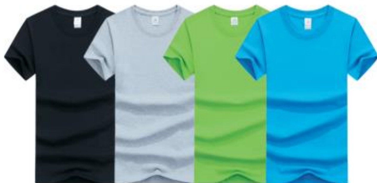
黑色 麻灰 明绿 湖蓝