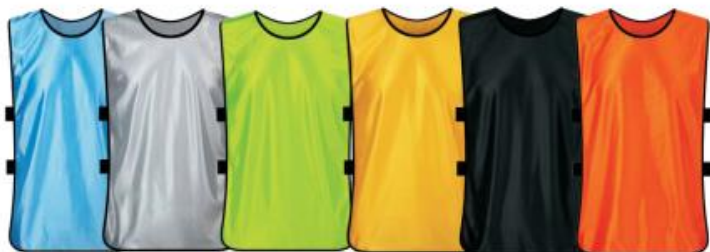
天蓝 银灰 荧光绿 黄色 黑色 橙色