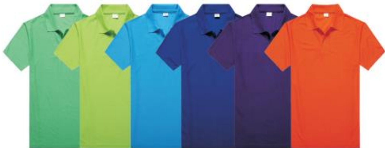
正绿 明绿 湖蓝 宝蓝 紫色 橙色