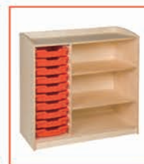
10层置物架 104 x 46 x 101 cm