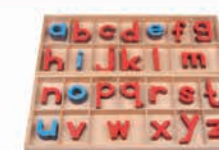
ML006 Large movable alphabet wood