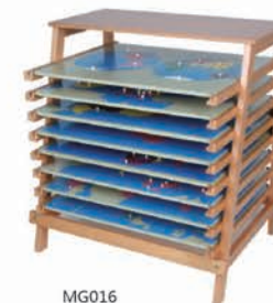
MG016 Stand for puzzle maps