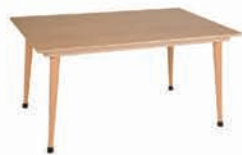
长桌子 120 x 80 x 59 cm