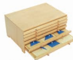
MS013 Geometric cabinet