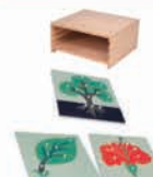
MB004 3 Botany puzzles