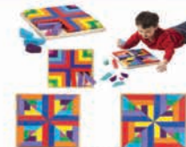
EZ1121-1 彩色形状拼图 (带木托)