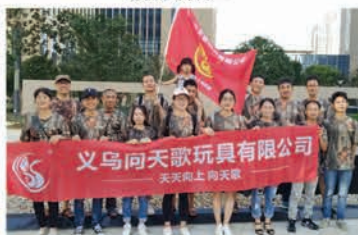
公司部分员工集体活动照

浙江好童年玩具制造有限公司 2008年，创始人马焕龙先生和台湾贤祺实业廖兴在先生联合开创“向天歌”品牌。随着在国际市场的优秀发展需求，2012年在中国木制玩具基地，浙江丽水云和，建立云和向天歌玩具有限公司，生产，OEM，设计研发 木制玩具，教具。2015年成立龙泉市向天歌玩具厂，主要负责幼儿园构建区木制大积木，户外碳化积木，幼儿园课桌椅的研发和生产。因为热爱，我们一直没有停下前进的脚步，2017年成立浙江好童年玩具制造有限公司，是集研发设计，生产销售为一体的综合性玩具教具厂，产品主要以蒙特梭利教具，福禄贝尔教具，幼儿园大积木，木制玩具等，涵盖益智玩具类，学前教育类，角色扮演类，拼图拼板类，木制乐器类，画板类，串珠类，木制车类；产品远销欧美，澳大利亚、香港、东南亚等50多个国家。公司有自主品牌“向天歌”、Goodkids, sing2sky。拥有完整、科学的ISO9000和ISO14000质量与环境管理体系。因为云和地处浙江山区腹地，物流及其不方便。所有货物都要中转义乌到全国，我们为了更好的服务客户，在义乌建立大型中转仓库，能第一时间安排给客户发货，并且能清楚及时查询到物流信息。