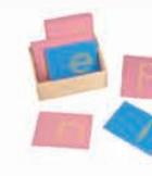
ML029 Sandpaper letters lower case print with box