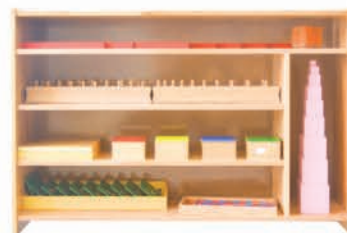
XTK006 Beech montessori cabinet

蒙台梭利教具，是由20世纪意大利著名教育家，蒙台梭利教育法的创始人-玛利亚·蒙台梭利依据其教育思想所发明设计。在我国，因为翻译不同，导致蒙台梭利教具还有其他名称，如：蒙特梭利教具、蒙特梭瑞教具；也有人称它为蒙氏教具。蒙台梭利教具主要分6大领域，感官教育教具、数学教育教具、语言教育教具、科学文化教育教具、日常生活教育教具及音乐教育教具。在蒙台梭利教具中，最经典的教具为感官教育教具部分，例如：插座圆柱体、粉红塔、棕色梯、长棒等。