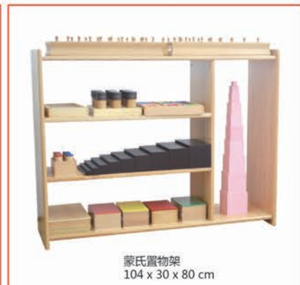
蒙氏置物架 104 x 30 x 80 cm