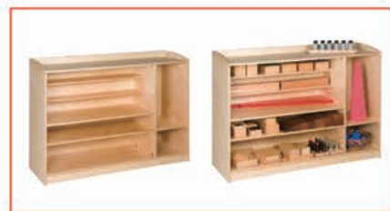
三层置物架 138 x 46 x 101 cm