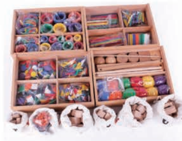
GABE11 福祿贝尔教具11件套

福祿贝尔教育外形从简单到复杂，具有连续性。通过分解、组合点、线、面、体等几何方面的基本图形，使幼儿在摆弄和游戏中理解数学原理，通过对各种图形的分类、排列、组合与分解，提高他们的专注力、构想力、思考力及创造力。幼儿可以在对实物观察的基础上根据物体特征构想出图形，利用这些材料进行拼摆、堆砌、拆装。这些活动家长反复进行，幼儿很容易理解整体和部分的关系，发展了想象力、创造力。幼儿在愉快的游戏中获得了知识，学习了推理，发展了语言，加强了同伴之间的交往。