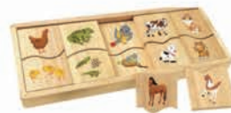
EC066 动物母子配对游戏