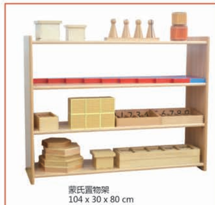
蒙氏置物架 104 x 30 x 80 cm