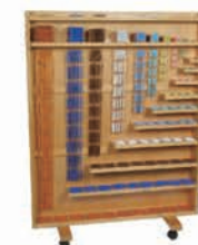
MM021 Complete Bead Material without Rack