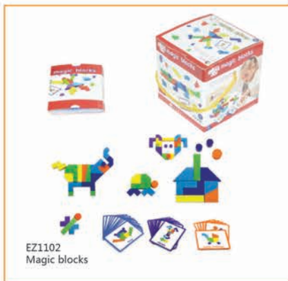
EZ1102 Magic blocks