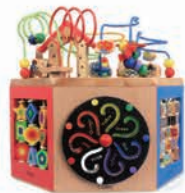
EZ3001-3 多功能六面大绕珠