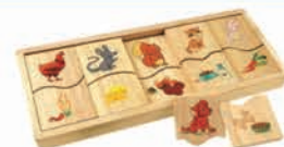
EC065 动物食物配对游戏