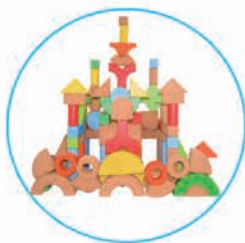
100PCS超大彩色软木积木基本配置表：(cm)