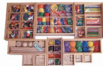
GABE14 福祿贝尔教具14件套