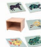
MB008 Cabinet for 5 zoology puzzles