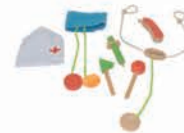
EZ8011-1 Doctor set toys