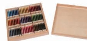
MS008 Color Tablets