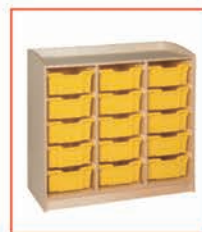
15格置物架 104 x 46 x 101 cm