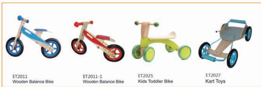
ET2011 Wooden Balance Bike