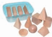
EZ1082 几何积木 (12个一套)