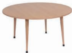
圆桌子 115 x 59 cm