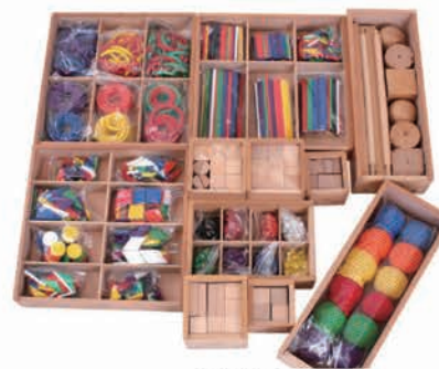
GABE15 福祿贝尔教具15件套