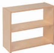
2层架子 73.5 x 30 x 64 cm